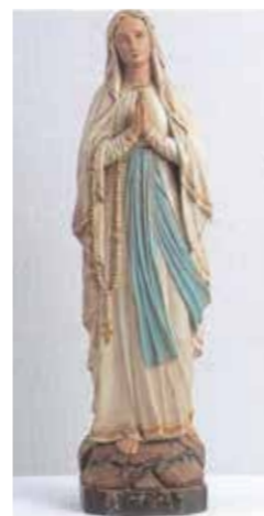
聖マリアの名前の由来のマリア像

日本の近代国家の明治が近づくと共に来日したローカーニュ神父は日本人神父の養成を始めた。司祭館の屋根裏部屋に数人の少年を住ませラテン語学校として神父養成を始めた。この数人の神学生の中に、一郎の母方の祖父(父方)と